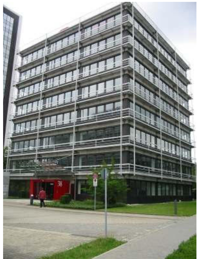
... und heute