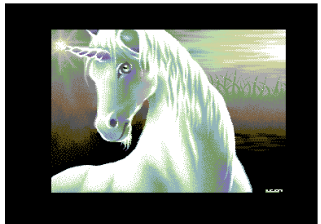
Unicorn von Leon – vielleicht eines der schönsten MU-FLI-Bilder und dem ein oder anderen aus Chorus' gleichnamiger Hochglanzdemo bekannt.

Die Undo-Funktion des Editors kann sich 32 Schritte merken, die allerdings gelöscht werden, wenn man entweder das gesamte Bild löscht oder das Diskmenü aufruft. Wer jetzt neugierig geworden ist, findet das Tool in der csdb.