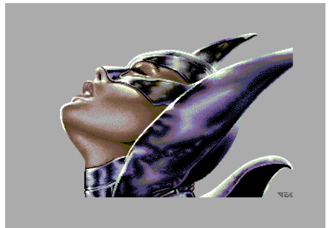
Batgirl von TCH – ich war ein böser Junge und muß bestraft werden ... leider ist der eindrucksvolle MU-FLI-Modus in der C64-Gemeinde nicht allzu verbreitet und nur eine handvoll Demos glänzen mit ihnen. Schade, wir sehen da großes Potential für ein unglaublich bombastisches Grafik-Adventure – fühlt sich denn da niemand berufen?