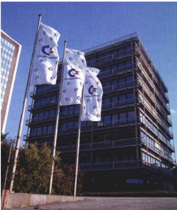
Damals mit Commodore-Fahnen ...

So sieht sie heute aus – die Lyoner Str. 38, die ehemaligen Zentrale von Commodore Deutschland, die immer noch steht! Hier die Bilder vorher und wie es heute aussieht.